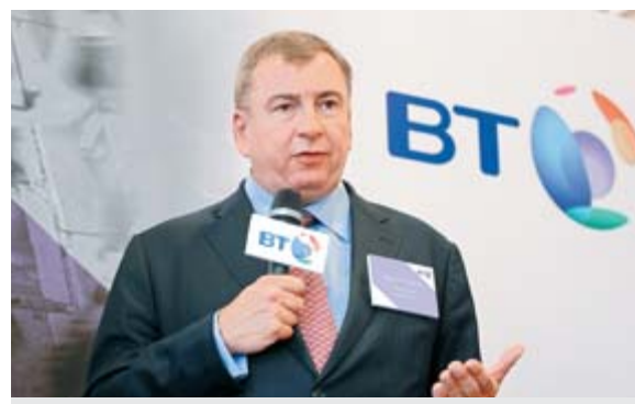
Taylor強調，BT十分重視內地的潛在市場，並制訂了三大策略拓展。